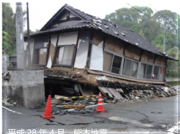
平成28年4月 能本地震